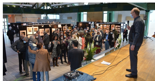
La remise des prix

Car une telle manifestation est une œuvre collective qui ne pourrait avoir lieu sans l'aide et la disponibilité de chacun.