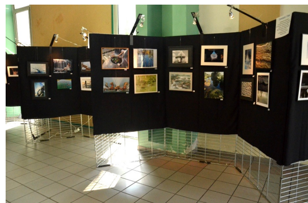
Les photos proposées au vote du public