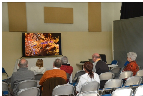
Projection d'images numériques