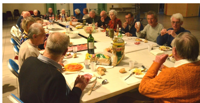
Le buffet final