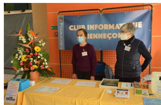
L'accueil du public