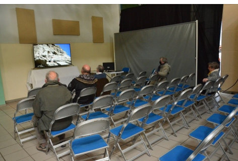
Projection de diaporamas par J.L. TERRIENNE